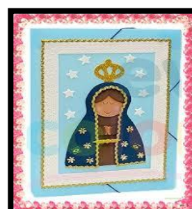
TELA DE PAPELÃO