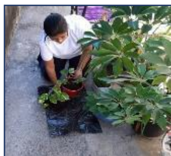
CUIDAR DAS PLANTAS DO JARDIM

Agora temos algumas situações em que nós professoras praticamos e demonstramos o amor pela natureza e meio ambiente.