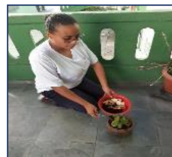
FAZER ADUBO CASEIRO PARA A HORTA