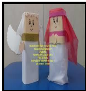
CAIXINHA DE REMÉDIO