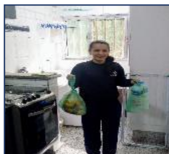
SEPARAR LIXO COMUM DE LIXO RECICLAVEL