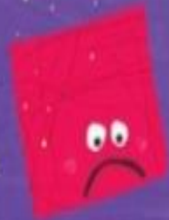
Planeta quadrado triste