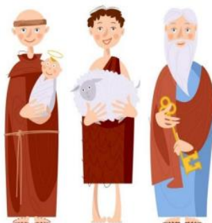
Santo Antônio São João São Pedro

Em todo o mês de junho a festa junina é tradicionalmente, realizada em várias regiões do Brasil, principalmente na região Nordeste.