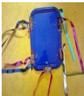
Pandeiro feito com tampa de sorvete Pandeiro feito com pratos de plásticos ou de alumínio.

Vale lembrar que esse momento de construção artística, deixa as crianças fascinadas e radiantes. Aproveitem e curtam essas experiências em família.