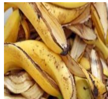
Casca de banana: 8 principais benefícios e como usar - Tua Saúde (tuasaude.com)

Rica em potássio, cálcio, minerais, fósforo e ricas em fibras. Podendo ser utilizada em vitaminas, bolos, sobremesas, pães, em forma de farinhas, empanada e também como chá.