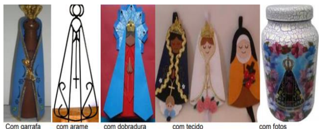
Com garrafa com arame com dobradura com tecido com fotos

Maria a mãe de Jesus, retrata as várias Marias que conhecemos através das imagens formadas pelas várias Virgens Marias existentes no mundo? Maria, mãe de Deus, é uma só, mas nós a invocamos por diversos títulos, pois ela sempre quer estar perto das pessoas e em situações de muita necessidade