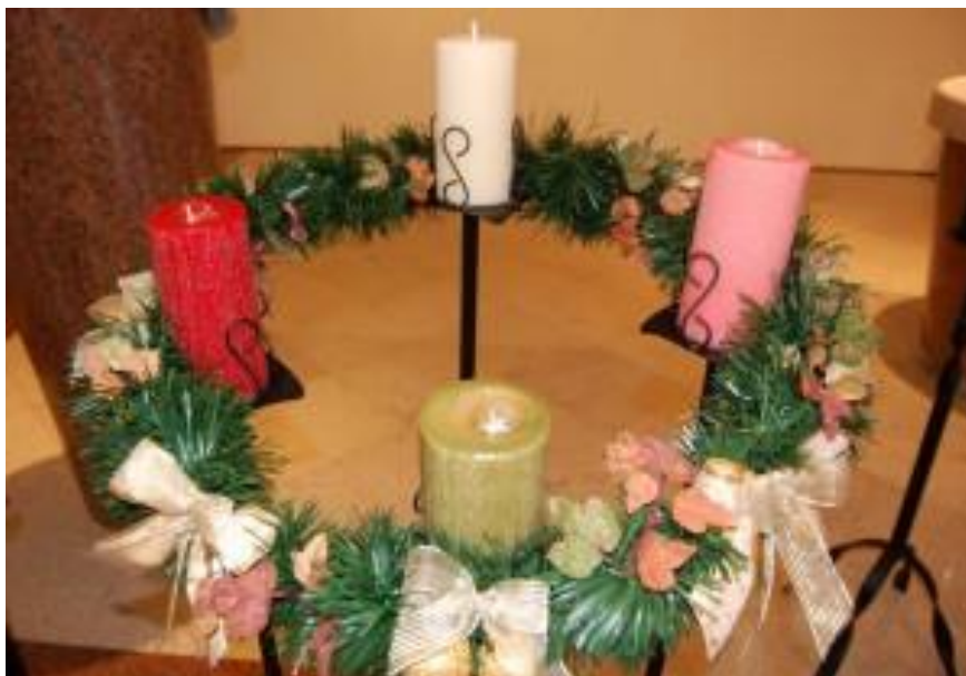
A coroa do advento.

O Momento Orinha é destinado para nutrir a fé e o amor junto as crianças. Ele deverá ser realizado todos os dias em família.