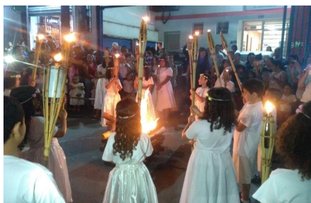
Festa da fogueira e da lanterna na comunidade