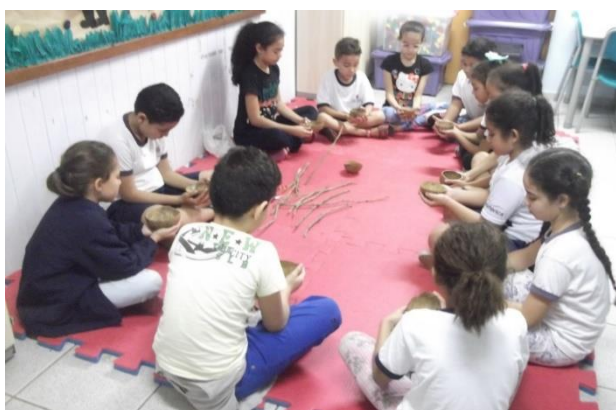
Confecção da lanterna em 2019

Aqui temos algumas vivências de momentos muito especiais realizados com as crianças, adolescentes, familiares e comunidade, junto a Família CEI SER. Como é bom recordarmos esses momentos!