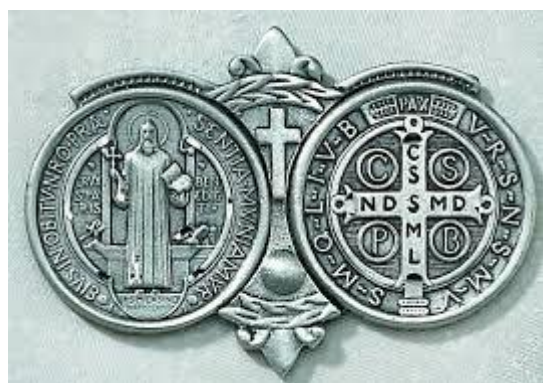
Imagem da medalha de São Bento

O hábito ou 'batina' preta de São Bento simboliza a Ordem dos Beneditinos fundada por ele. Após ter vivido três anos como eremita, dedicando-se totalmente à oração, Bento passou pelo convento e depois fundou a Ordem dos Beneditinos conforme o Espírito Santo lhe inspirara. O hábito preto expressa a forte espiritualidade de ascese e sacrifício.