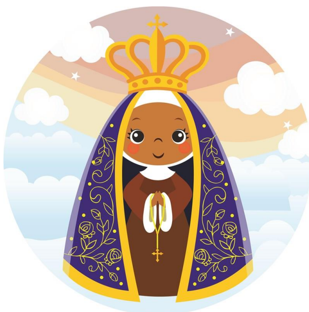
Nossa Senhora Aparecida.