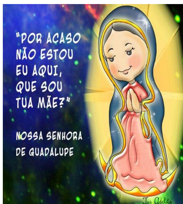
Nossa Senhora de Guadalupe.

Nesta semana queríamos contar para vocês que estaremos apresentando, um dos títulos de MARIA.