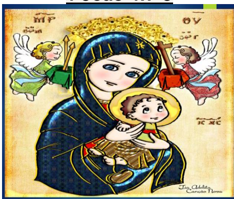
N.S do Perpétuo Socorro.